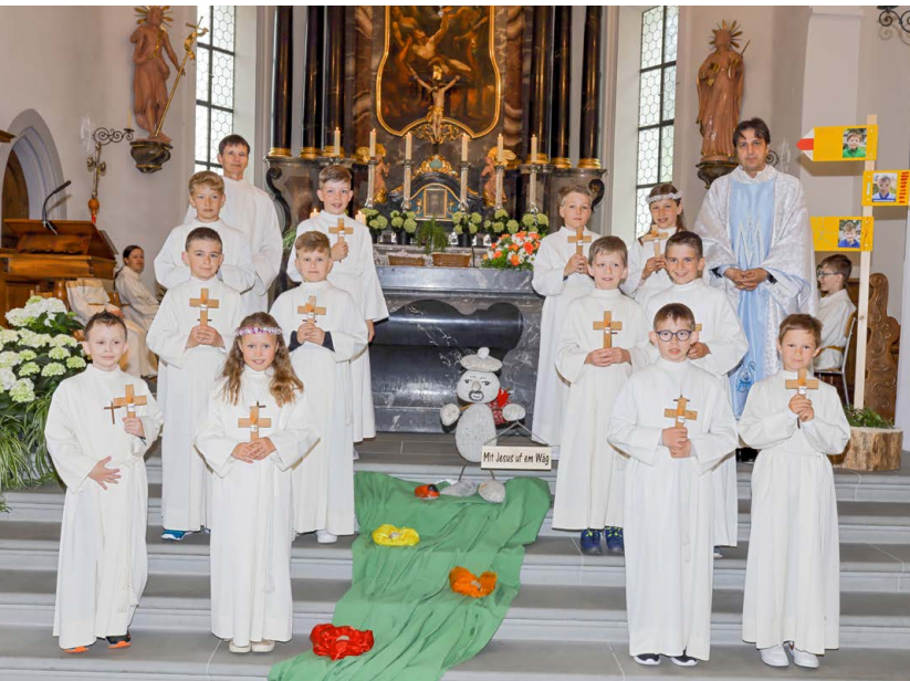
Gruppe St. Laurentius, Rudenz.