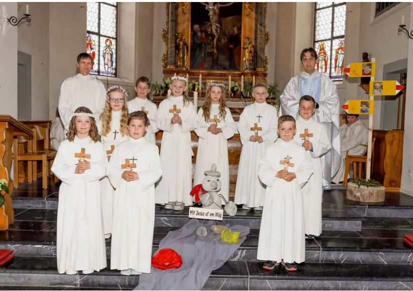
Gruppe St. Anton, Grossteil.