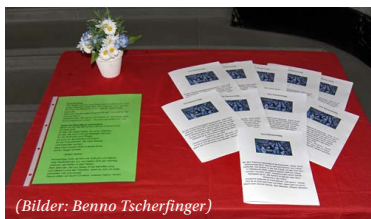
(Bilder: Benno Tschering)