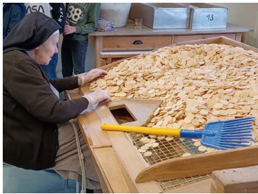
Sr. Petra beim Sortieren.