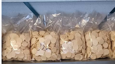
Bereit zum Versand.